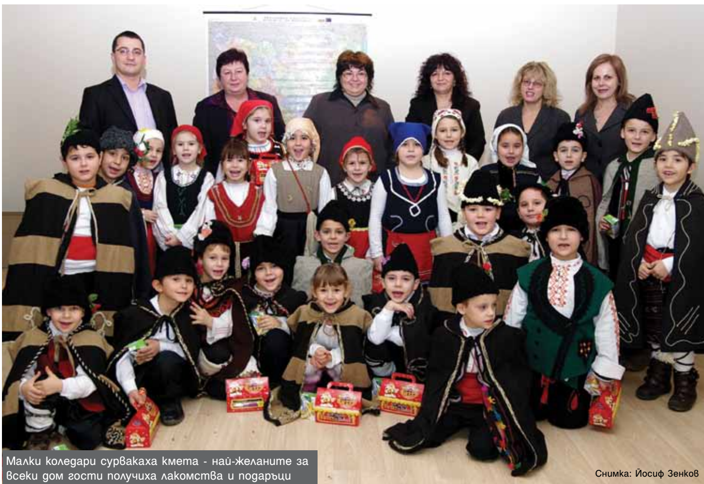
Малки коледа сурвакаха кмета - най-желаните за всеки дом гости получиха лакомства и подаръци